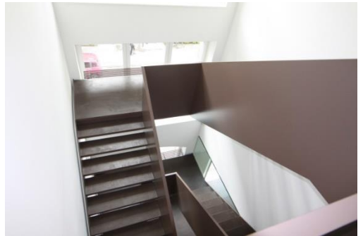
luftiges Treppenhaus mit Lift